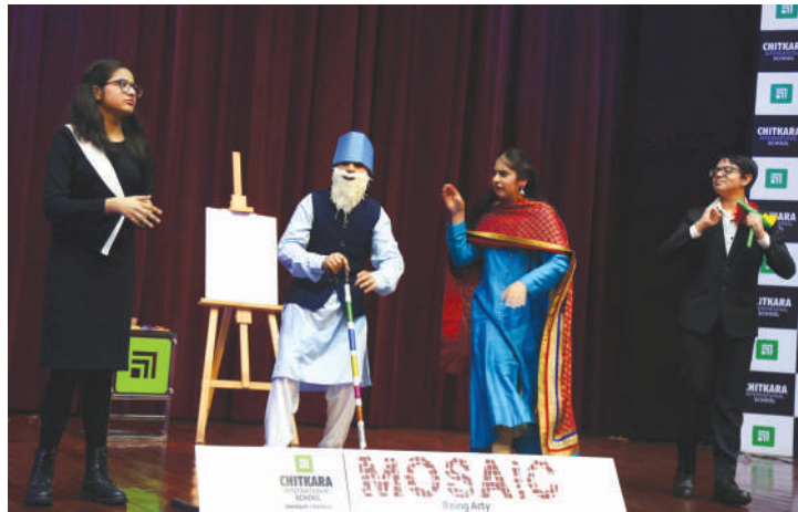
जानी जाती है और कला आत्म अभिव्यक्ति को सबसे प्रामाणिक तरीके से सामने लाने में मदद करती है। स्कूल के दसवें वार्षिक समारोह की थीम 'मोजेक बीइंग आर्टी' ने छात्रों को अपने प्रतिभा को उभारने के लिए प्रेरित किया। हम अपने प्रयास की सफलता पर संतुष्ट हैं और यह हमेशा हमारे दिलों के करीब रहेगा।