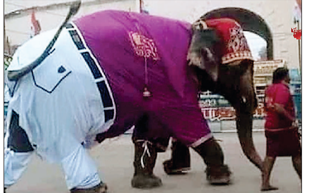
आनंद महिंद्र ने हाथी की पैट-शर्ट और बेल्ट पहने एक तस्वीर ट्विटर पर पोस्ट की है जिसे उन्होंने एलीफेंट की जगह एली-पेंट नाम दिया है।

इसके अलावा 8 मार्च को महिला किसान दिवस मनाया जाएगा और सभी घरने महिलाएं सभाओं में। मंच प्रबंधन करेंगी और वक्ता होंगी। मोर्चा ने कहा कि 8 मार्च को महिला संगठनों व अन्य लोगों को आमंत्रित किया गया ताकी वह किसान आंदोलन के समर्थन में इस तरह के कार्यक्रम करें और देश में महिला किसानों के योगदान को उजागर करें।