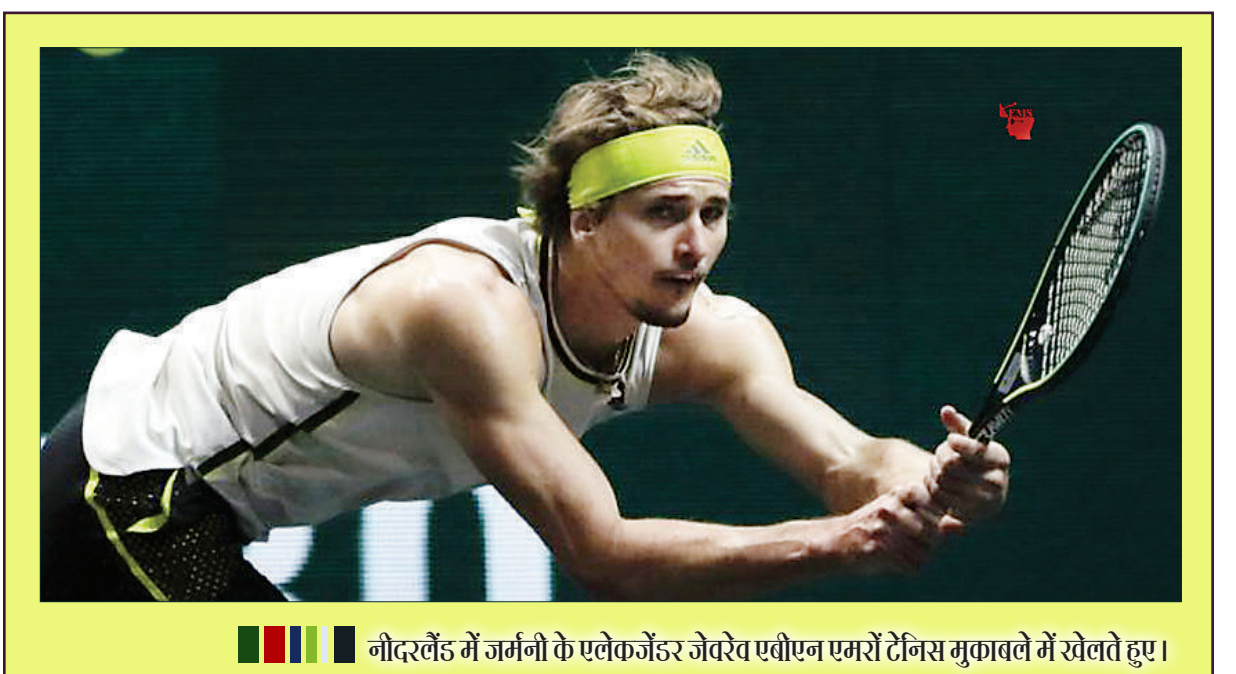
नोदरवैंड जर्मनी के एलेक्जेंडर जेवरेव एबीएन एमरो टेनिस मुकाबले में खेलते हुए।

टोक्यो। आगामी टोक्यो ओलंपिक के पैल में महिलाओं की हिस्सेदारी बढ़ी है। बोर्ड में 12 और महिलाओं को शामिल किया जिससे 45 सदस्यीय समिति में उनकी संख्या बढ़कर करीब 19 (लगभग 42 फीसदी) हो गयी है। इस समिति में महिलाओं को शामिल करने के लिए बोर्ड में सदस्यों की संख्या को 35 से बढ़ाकर 45 हो गयी जबकि कुछ सदस्यों को इस्तीफा भी देना पड़ा। कार्यकारी बोर्ड की बैठक के बाद इस कदम की घोषणा मुख्य कार्यकारी अधिकारी मुत्सु ने की। आयोजन समिति की नयी अध्यक्ष सीको हाशिमोतो की पहल पर यह बदलाव किए गए। पिछले महीने 83 साल के पूर्व अध्यक्ष योशिरो मोरी के महिलाओं पर की गयी टिप्पणी और उनके इस्तीफे के बाद हाशिमोतो ने बोर्ड की बैठक में मोरी ने महिलाओं के खिलाफ लैंगिंग टिप्पणी की थी। उन्होंने कहा था कि महिलाएं काफी बातें करती हैं। हाशिमोतो ने बोर्ड की बैठक की शुरुआत में कहा कि लैंगिंग समानता को बढ़ावा देने के मामले में हमारा मानना है कि आयोजन समिति में विश्वास बहाल करने के लिए तेजी से काम कर दोस परिणाम देना होगा।