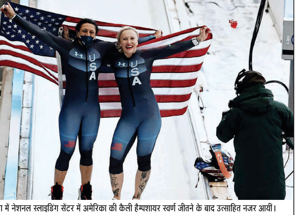
बीजिंग में नेशनल स्लाइडिंग सेंटर में अमेरिका की कैली हैम्पशायर स्वर्ण जीतने के बाद उत्साहित नजर आयीं।

दिल्ली की टीम के साथ जुड़ गए थे। बेंगलोर के साथ दोबारा जुड़ने की बात पर उन्होंने कहा, ह्यजब उन्होंने मुझे दिल्ली से दोबारा ट्रेड किया तो उन्होंने मुझे वह मौका और जिम्मेदारी दी जिसे पूरा करने की मैं उम्मीद नहीं कर रहा था। उन्होंने मेरा साथ दी। मुझमें कुछ देखा और यह सब बहुत मायने रखता है। कीमत बेशक काफी ज्यादा है और इसके साथ ही जिस तरह से उन्होंने मुझ पर भरोसा जताया वह मेरे लिए काफी मायने रखता है। नीलामी के दौरान हर्षल पर तेजी से बोली लगनी शुरू हो गयी। पहले पहले आरसीबी ने उसपर बोली लगायी, इसके बाद चेन्नई सुपर किंग्स भी इसमें उतर गयी हालांकि बाद में सुपरकिंग्स हट गयी। अंत में हर्षल को 10.75 करोड़ रुपये मिले। हर्षल का पिछले आईपीएल में अच्छा प्रदर्शन रहा था।