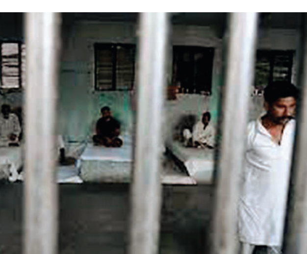
कैदियों की कुल संख्या में दोषी साबित होने वाले कैदियों की संख्या में कमी आई है। इसके परिणामस्वरूप विचाराधीन संख्या कम होने के बावजूद अनुपात बढ़ गया है। दिल्ली में भी, जहां विचाराधीन कैदियों की संख्या 82 फीसदी से बढ़कर 91

नई दिल्ली, एजेंसी। देश की जेलों में विचाराधीन कैदियों की संख्या में 2020 में तेजी से बढ़ोतरी हुई है। स्थिति यह है कि जेल में बंद करीब 5 लाख कैदियों में 75 फीसदी कैदी विचाराधीन हैं। यह जेल में बंद कैदियों की संख्या तीन-चौथाई से अधिक थी जो कम से कम एक दशक में सबसे अधिक अनुपात था। ऐसे में करीब तीन लाख से अधिक कैदी अदालत से फेसले आने का इंतजार कर रहे हैं। राष्ट्रीय अपराध रिकॉर्ड ब्यूरो (एनसीआरबी) एनसीआरबी के आंकड़ों से पता चलता है कि 2015 से देश की जेलों में बंद विचाराधीन कैदियों की संख्या में 30 फीसदी से अधिक की वृद्धि हुई है। जबकि कैदियों के दोष सिद्ध होने की संख्या में 15 फीसदी की कमी आई है। हालांकि, जमानत पर रिहा किए जाने के कारण सन 2020 में 2019 की तुलना में विचाराधीन कैदियों की संख्या में 2.6 लाख की कमी आई है। हालांकि, अलग-अलग राज्यों में अलग-अलग पैटर्न हैं। इसके वजह जेलों में सुनवाई के लिए कई संगठित वीडियो कॉन्फ्रेंसिंग सुविधाएं हैं।