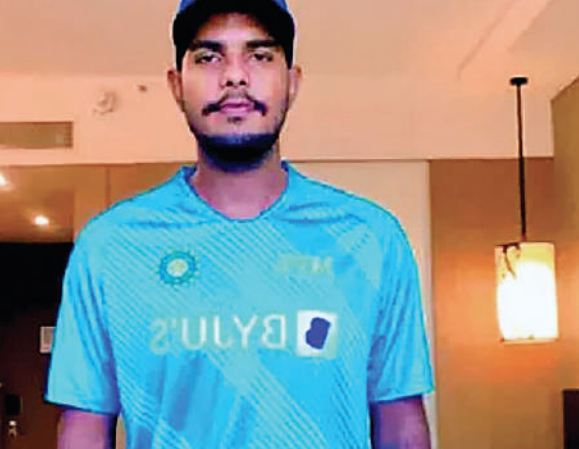
सबसे पहले पिता को फोन किया, तब पता चला कि उन्हें आईपीएल में चुन लिया गया है और गुजरात टाइटंस टीम ने उन्हें बेस प्राइस से 16 गुना ज्यादा कीमत देकर 3.2 करोड़ रुपये में खरीदा है। वहीं पिता इस बार से परेशान थे कि वह