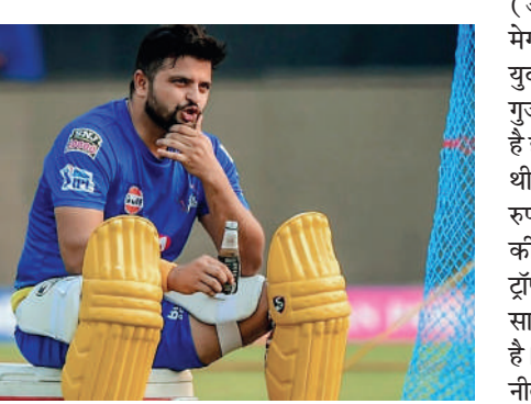
धोनी ने अंतरराष्ट्रीय क्रिकेट से संन्यास की घोषणा की थी, इसके कुछ समय बाद ही रैना ने भी सोशल मीडिया के जरिए संन्यास की घोषणा की थी। रैना ने अब तक 205 आईपीएल मैचों में 136.73 के स्ट्राइकरेट से कुल 5528 रन बनाये हैं। इस दौरान उन्होंने 1 शतक और 39 अर्धशतक लगाए हैं।

बेंगलुरु, एजेंसी। इंडियन प्रीमियर लीग (आईपीएल) के 15 वें सत्र के लिए हुई मेगा नीलामी में बल्लेबाज सुरेश रैना को नहीं खरीदे जाने से उनके प्रशंसकों में निराशा है। रैना आईपीएल में सबसे ज्यादा रन बनाने वाले बल्लेबाज हैं। वह अधिकतर समय महेन्द्र सिंह धोनी की टीम चेन्नई सुपरकिंग्स (सीएसके) में रहे हैं पर इस बार सीएसके ने तक उनपर बोली नहीं लगायी। इससे पहले सीएसके ने उन्हें रिटन नहीं किया था। आईपीएल खिलाड़ियों की नीलामी में रैना ने अपना बेस प्राइस 2 करोड़ रुपये रखा था पर 10 फ्रेंचाइजी टीमों में से किसी ने भी उनमें रुचि नहीं दिखाई। आईपीएल नीलामी में नहीं बिकने के बाद अब प्रशंसकों को लग रहा है कि रैना का क्रिकेट करियर करीब समाप्त हो गया है। कोई फ्रेंचाइजी चाहे तो नीलामी के बाद भी इस बल्लेबाज को शामिल कर सकती है पर इसके संभावनाएं नहीं हैं। रैना और धोनी ने अंतरराष्ट्रीय क्रिकेट को एक ही दिन अलविदा कहा था। साल 15 अगस्त 2020 को पहले