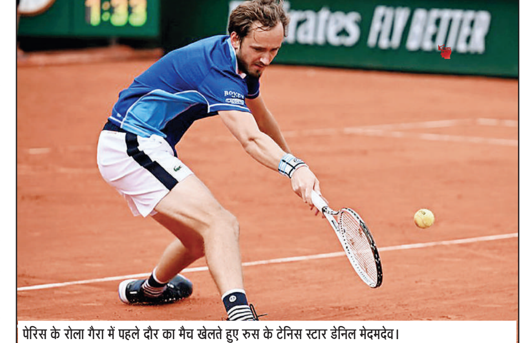
पेरिस के रोला गैरा में पहले दौर का मैच खेलते हुए रुस के टेनिस स्टार डेनिल मेदमदेव।