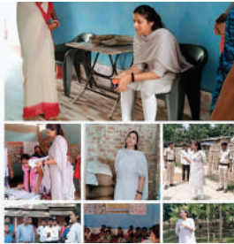
अंचलाधिकारी, थाना अध्यक्ष एवं माननीय मुखिया के साथ बैठक कर निराकरण करने का निर्देश दिया गया।

अररिया। बुधवार को डीएम इनायत खान के दिशा निर्देश में संबंधित प्रखंड के वरीय पदाधिकारी एवं संबंधित पदाधिकारी द्वारा अपने-अपने क्षेत्र अंतर्गत संचालित जनकल्याणकारी तथा विकासात्मक योजनाओं के क्रियान्वयन को लेकर स्थलों का भौतिक निरीक्षण किया जा रहा है।