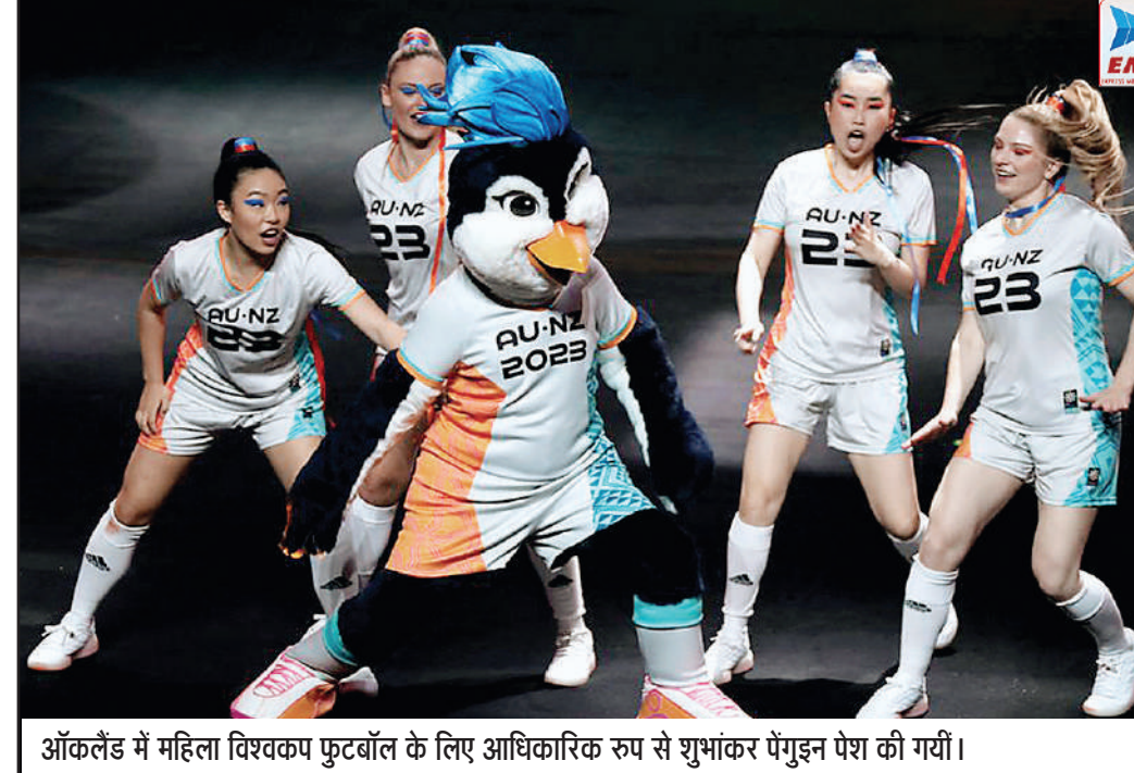
ऑकलैंड में महिला विश्वकप फुटबॉल के लिए आधिकारिक रूप से शुभांकर पेंगुइन पेश की गयीं।

नहीं बुलाएगा। परीक्षण के दौरान मुझे पूछा गया कि मुझे किसने भेजा है। उन्होंने कहा मैंने पाकिस्तान में हर स्तर पर सफलतापूर्वक खेला है, लेकिन देश का प्रतिनिधित्व करने का सपना पूरा नहीं हुआ। उन्होंने प्रदर्शन का मंच देने के लिए दक्षिण अफ्रीका क्रिकेट को धन्यवाद दिया। इमरान ताहिर ने 2011 में टेस्ट और वनडे क्रिकेट में पदार्पण किया, जिसके बाद उन्होंने 2013 में टी20 अंतरराष्ट्रीय में खेला था। इमरान ताहिर ने कहा मुझे मौका देने के लिए मैं दक्षिण अफ्रीका का शुक्रगुजार हूँ। मुझे मौका मिल रहा था और जब वह मुझे दिया गया तो मुझे इसका फायदा मिला। उन्होंने कहा मैं क्रिकेटर्स को सलाह दूंगा कि वे कभी भी हिम्मत न हारें और अवसरों की तलाश करें। मैं दुनिया के लिए