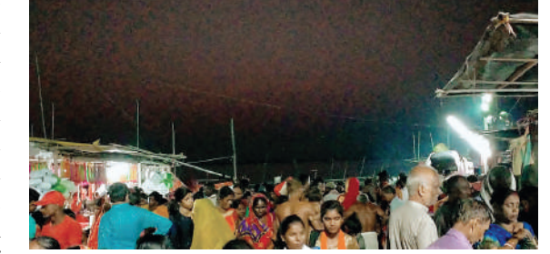
» मदरलैण्ड संवाददाता

कटिहार। सूर्य ग्रहण की समाप्ति के बाद मनिहारी गंगा तट पर लगी आस्था की डुबकी ग्रहण के बाद धार्मिक मान्यताओं के अनुसार दान धाम पवित्र नदियों में स्नान करने की बात कही गयी है जिसके कारण कटिहार के मनिहारी स्थित गंगा घाट पर भारी हजारों की संख्या में लोग गंगा स्नान करने पहुंचे इस दौरान श्रद्धालुओं के साथ साथ लोगों की काफी भीड़ उमड़ पड़ी है। सूर्य ग्रहण 4 बज कर 42 मिनट से शुरू होकर शाम 5 बजकर 08 मिनट में खत्म हुआ उसके बाद श्रद्धालुओं की भीड़ धीरे धीरे मनिहारी गंगा घाट पर उमड़ पड़ा। कटिहार के मनीहारी प्रशासन भी छठ ब्रत के साथ साथ ग्रहण के बाद श्रद्धालु मनिहारी गंगा घाट पर पहुंच कर मोक्षदायिनी गंगा में स्नान करेगे इसको लेकर मनिहारी गंगा घाट पर विशेष तैयारी कर रखी है। साफ-सफाई के साथ बिजली और गोताखोर की भी व्यवस्था की गयी है। जिससे कोई अप्रिय घटना ना घटित हो इसका पूरा खयाल रखा जा रहा है।